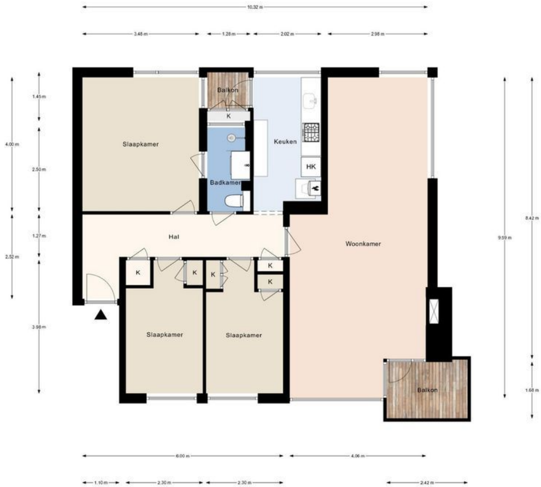
Kijkduinsestraat 892, Den Haag | 1e verdieping H= 2.70m